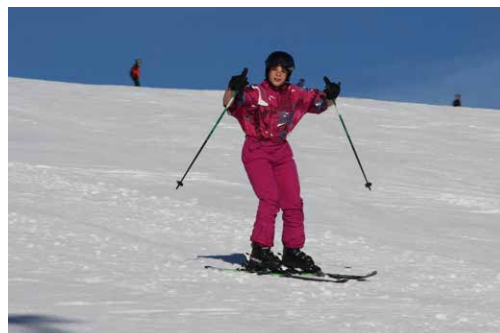
Zell am See, januari 2020.

De niet meer weg te denken skireis mag ook deze keer weer zeer geslaagd genoemd worden. De 75 deelnemers hebben niet alleen goed leren skiën maar zij hebben zich daarbij ook van hun beste kant laten zien! Samen met de begeleiders hebben ze ervoor gezorgd dat de sfeer bijzonder goed was, en dat zonder alcohol... Een bezoekje aan het lokale zwembad met glijbaan en hoge duikplank was zeer verfrissend. De optredens op de bonte avond waren weer om van te smullen en menig voetje ging van de vloer. Gelukkig zijn er geen skiongelukken gebeurd en is iedereen weer veilig terug. Deelnemers, jullie nogmaals bedankt voor deze gezellige superweek vol met saamhorigheid!