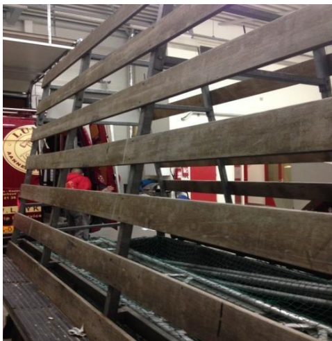
Aanhanger met opzet voor glas en kozijnen

We gingen eerst naar de werkplaats om daar de steigerdelen op te halen en de aanhanger achter de bus te monteren.