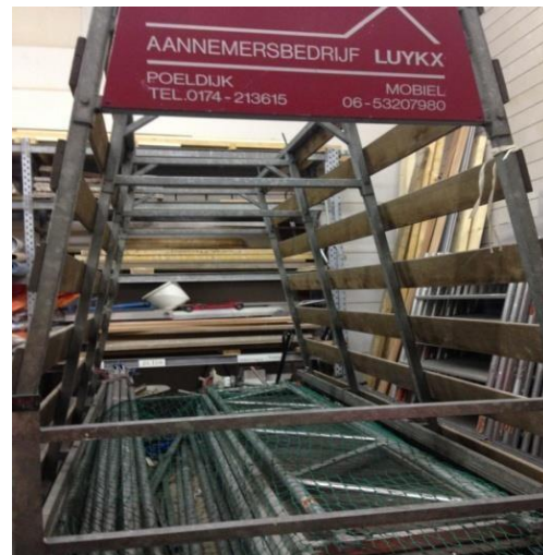
De steigerdelen plat in de aanhanger